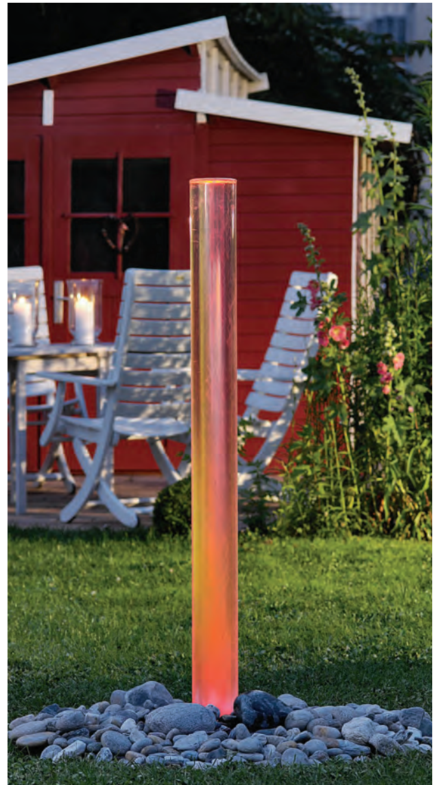
LEUCHTEND ROT steht die Wassersäule mit eingeschalteter Beleuchtung im Dämmerlicht