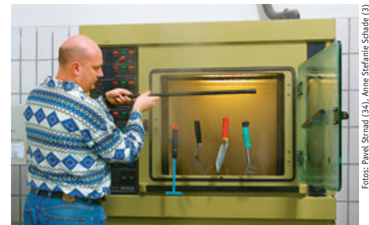
In der Klimakammer kann die Bewitterung mehrerer Monate in nur wenigen Tagen nachgeahmt werden. Künstlicher Salznebel ersetzt dabei Regen und hohe Luftfeuchtigkeit. Wer hier besteht, hält auch dem Gartenalltag stand