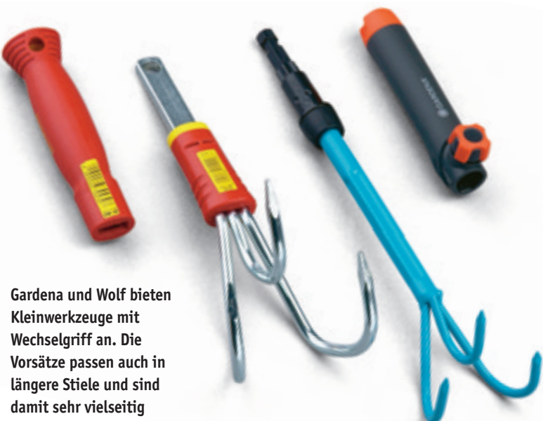
Gardena und Wolf bieten Kleinwerkzeuge mit Wechselgriff an. Die Vorsätze passen auch in längere Stiele und sind damit sehr vielseitig