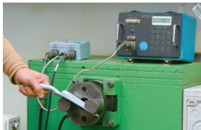
In diesem Test wurde gemessen, wie belastbar die Werkzeuge bei der Betätigung sind – nur wenige Werkzeuge zeigten hier Schwächen, und dies auch erst oberhalb der im Freiland auftretenden Werte