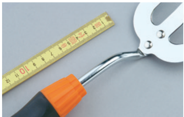
Bei den Werkzeugen von Master ist eine Feder eingebaut, die den Griff gegenüber der Werkzeugspitze entkoppelt. Alle von uns befragten Nutzer sahen in dieser Ausstattung jedoch keinen Nutzen für die Praxis

in dieser Werkzeuggruppe bestens beraten. Verarbeitung, Stabilität, Dauerhaftigkeit und Ergonomie – in allen Kategorien ernteten die Vollkunststoffgeräte beste Noten. Dicht auf folgen die Kleingeräte von Gardena und Lux . Gardena macht vor, wie man mit einer fachgerecht aufgebracht Pulverbeschichtung einen vorbildlichen Rostschutz erreichen kann. Die ergonomisch sehr guten Werkzeuge von Lux sind zwar feuchtigkeitsempfindlicher, dafür aber beinahe so stabil wie die geschmiedete Konkurrenz. Es folgt ein gemischtes Mittelfeld mit Geräteserien der bekannten Marken Gardena und Wolf , das von den geschmiedeten Werkzeugen